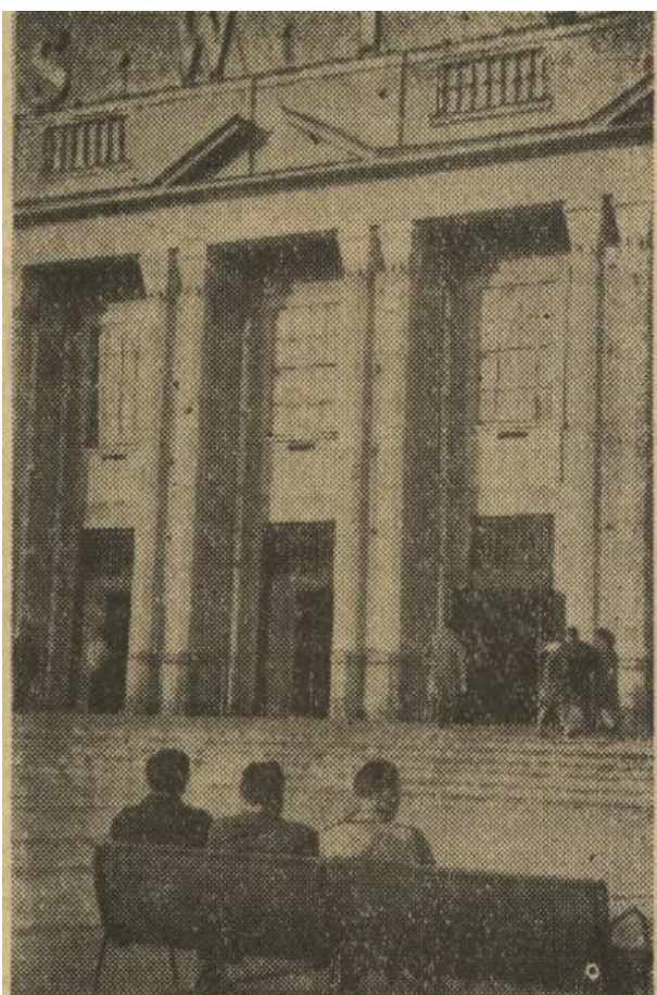
Można już usiąść w kwietniowym słońcu na ławeczce pod kinem „Swit”. Sporo ławek ustawiono w tym roku w najruchliwszych punktach Nowej Huty. Tę „aktualność” odnotowujemy z prawdziwą przyjemnością.

I gdzie ten salon Towarzystwa Sztuk Pięknych - Aleja Róż 13 - to tam, gdzie dzisiaj na rogu Centrum B i Parku Ratuszowego?