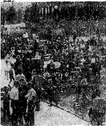
iu na występy artystyczne

TELEFONEM Z ZARABIA. Nad „najczystsza w Polsce rzeką” (tak głosiła zielona ulotka, nawołująca do spędzenia Lipcowego Święta w urodziwym zakątku Myślenie), było tym razem tyle słońca, że program jaki przygotowali organizatorzy, szedł bez przeszkód. Nowohutniczański ZMS, rozwinawszy miejskie i fabryczne zagony, ściągnął tu „zieloną linią” PKS i własnymi mikrobusami z górą 2 tysiące mieszkańców swojej dzielnicy. Młodzi hutniczanie patronowali wszystkim imprezom na Zarabiu. Grała więc w ośrodku CRZZ orkiestra dęta hutników, a w ośrodku PSS podrywał do tańca zespół „5 Pik”. Przygotowano sporo imprez sportowo-rozrywkowych na stadionie, łącznie z biegami w workach i pokazami dżudo, a pod szklanym dachem