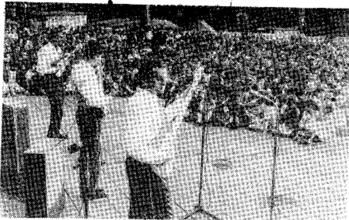
Zespół „Piasty” na estradzie w Rynku Głównym.

Taflę sztucznego jeziora przecina-ły rowery wodne i kajaki: 18 osad stanęło do zawodów. Nad parkiem wokół zalewu, przystrojonym cho-rągiewkami, splotającymi na li-pkach niczym z masztu okrętu, góro-wały tony koncertującej na estra-