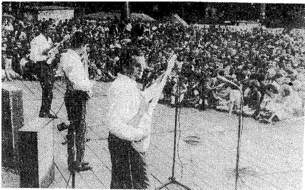
Zespół „Piasty” na estradzie w Rynku Głównym.

Trudno oczywiście odnotować tu wszystkich wykonawców, zespoły, artystów i aktorów. To oni spra-wili, że 22 lipiec 1965 roku w Kra-kowie był jeszcze bardziej pogodny i słoneczny. (ra)