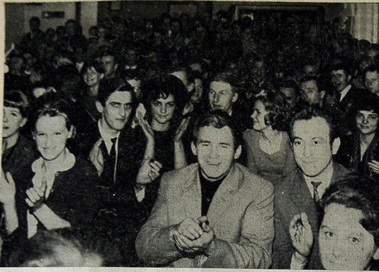
Zakładowy Dom Kultury HiL organizuje coraz więcej ciekawych rozrywkowych imprez artystycznych. Na dobrych imprezach zawsze dopisuje frekwencja, a jak czują się na nich widzowie świadczyć może chociażby to zdjęcie