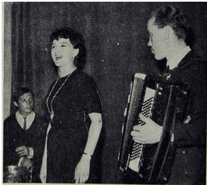
Jeden z występów konkursowych Olimpiady Kulturalnej HiL artystów amatorów z Pionu Głównego Mechanika